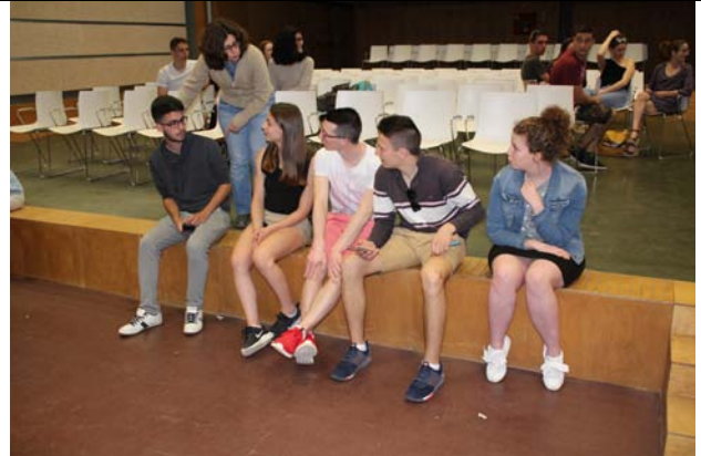
Petit atelier franco-espagnol pour découvrir les cultures des deux pays