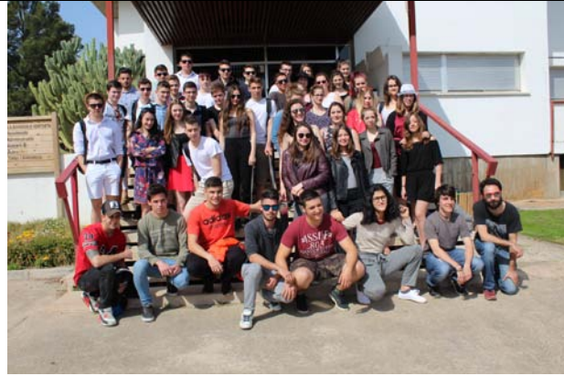
Rencontre avec les élèves de la Escola Agraria de Amposta