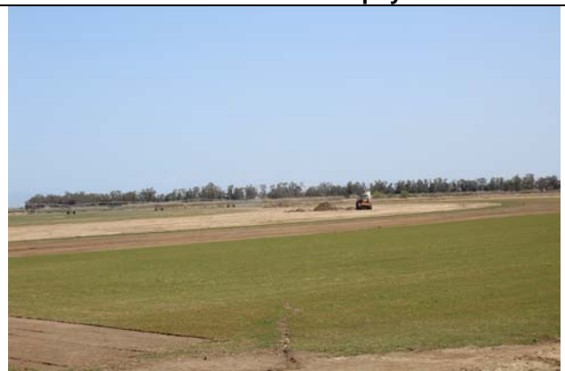
Les futurs greens ou terrain de foot de l'entreprise de production de gazon

Echange très riche et convivial entre nos élèves et ceux de l'Escuela Agraria de Amposta, l'équivalent catalan de nos lycées agricoles. C'est un petit établissement (80 élèves) qui forme aux métiers de l'agriculture, de l'horticulture et de l'aménagement paysagé. Après cette sympathique rencontre, le personnel de l'établissement nous a accompagné pour visiter une entreprise installée dans le delta sur près de 70 ha qui produit du gazon dont 60% sont destinés aux jardineries et 40 % pour les terrains de golf et de foot (Real Madrid notamment). A noter que 50 % de cette production sont exportés (majoritairement dans le sud de la France).